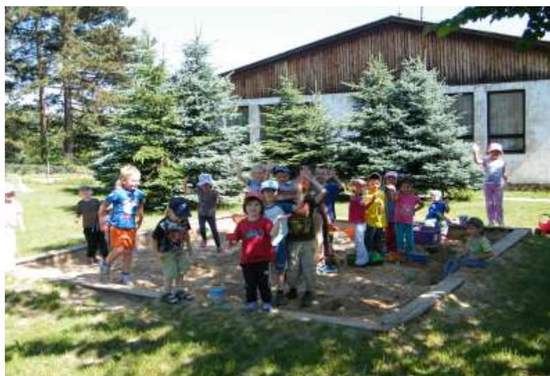
děti z naší mateřské školy

A konečně k aktualitám, které jsou jako vždy dobré i špatné. Velice dobrou zprávou je informace, že kontrola dotace na kanalizaci proběhla bez závad a dotace byla přiznána v plné výši a v nejbližších dnech bude proplacena na účet obce. Protože obec musí do konce června vrátit 8,5 mil. úvěr, tak to je velice pozitivní informace a nedostaneme se tak do hrozící dluhové pasti. Trochu horší zprávou je skutečnost, že naše žádost o rekonstrukci opláštění a výměnu oken u staré budovy mateřské školky byla vyřazena z důvodu nesouladu projektu a energetického auditu, což bylo dříve běžně akceptováno a v průběhu administrace dotace se uvedli